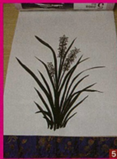
1. ソンゴク村のおばあさんが作ってくれた夜ごはん / 2. 道路沿いに広がるヤンジ村 / 3. 山間に広がる信生農園 / 4. 自分の住んでいる部屋まで案内してくれるおばあさん / 5. 愛楽園のおばあさんがカレンダーの裏に描いた絵