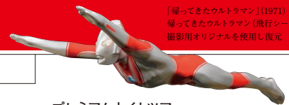
「帰ってきたウルトラマン」(1971) 帰ってきたウルトラマン(飛行シーン用) 撮影用オリジナルを使用し復元

〒860-0845 熊本市中央区上通町2-3(熊本市現代美術館の入口は「びぶれす熊日会館」3階です。)