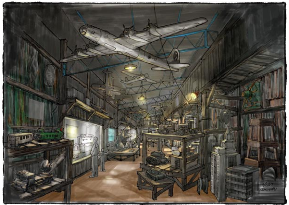
「特撮美術倉庫」(イメージ画:石森達也)