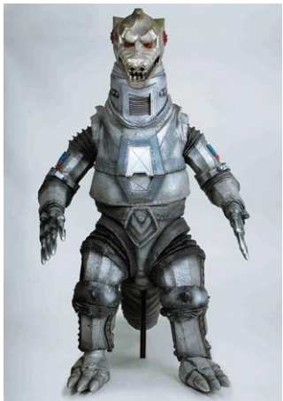
「メカゴジラの逆襲」(1975) メカゴジラ2スーツ 撮影用オリジナル TM&© TOHO.CO.,LTD