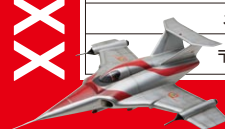
「帰ってきたウルトラマン」(1971) マトアロー1号 撮影用オリジナルを使用し復元 ©円谷プロ

[前売券・当日券取扱窓口] 熊本市現代美術館/熊日プレイガイド/JR九州 駅みどりの窓口 交通センタープレイガイド/イープラス(ファミリーマート)/セブンチケット ローンチケット【Lコード:82652】(ローン/ミニストップ) チケットぴあ【Pコード:766-593】(セブンイレブン/サークルK・サンクス)