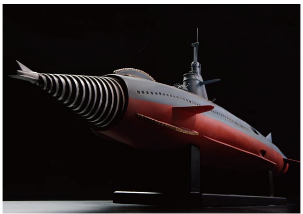
「海底軍艦」(1963) 海底軍艦 轟天号 撮影用オリジナルを使用し復元 TM&© TOHO.CO.,LTD

本展は怪獣・ヒーロー作品の世界に心躍る圧倒的なリアリティを与えた「ミニチュア特撮」、そして各分野の巨匠達の「ものづくり」の情熱の結晶として花開いた「特撮」に関するすべてを改めて検証し、さらなる可能性を求めて、未来を担う次なる世代へと発信する展示会です。