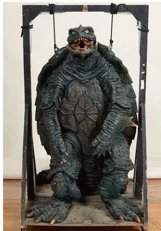
「ガメラ2レギオン襲来」(1996) ガメラ2スーツ 撮影用オリジナル