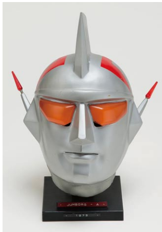
「ジャンボークA」(1973) ジャンボークAマスク 撮影用オリジナルを忠実に修復 ©円谷プロ