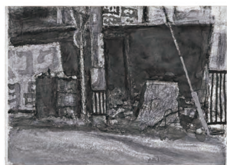
《倉庫の前》平成7年3月/水彩