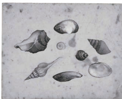
《習作》昭和2年頃/水彩