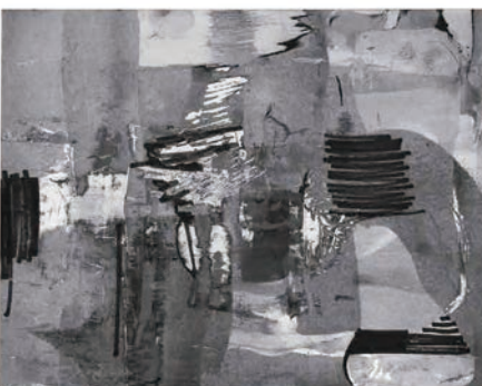
《私の手と心の抄》昭和35年から昭和47年頃/紙に水彩・クレパス等