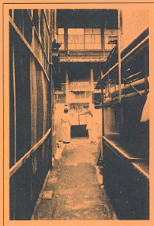
旅の絵はがき「新町」(新町)