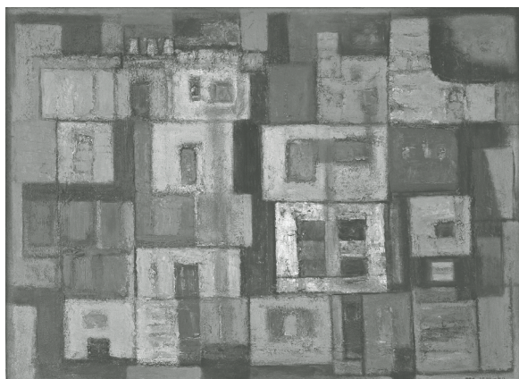
《建物の構成》 1958-60 年