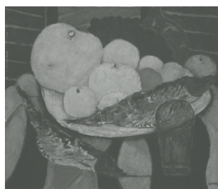
《静物》 1963 年