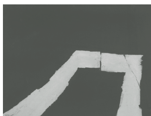
《城》 1981 年