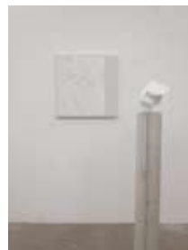
untitled 2010 ミクストメディア