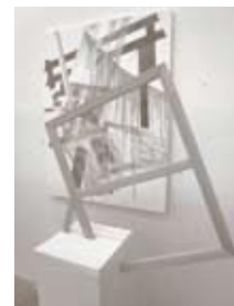
untitled 2009 木材・テープ・アクリル・スプレー・ カンバス