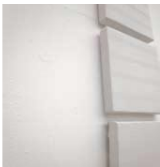
untitled 2010 スプレー・カンバス