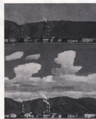
《私の住む街》2011年 116.7×91.0cm 油彩、キャンバス