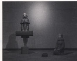
《影見 - Re:Substantia -》2009年 高さ 200cm(組作品) 樟に彩色