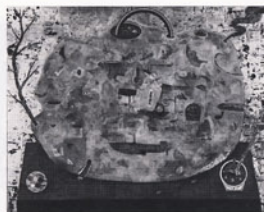
《おとぎのかたち②》2011年 130.0×162.0cm ミクストメディア、綿布、パネル