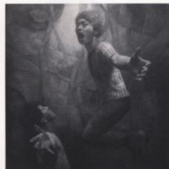
《上昇もしくは下降II》2010年 162.0×162.0cm ミクストメディア